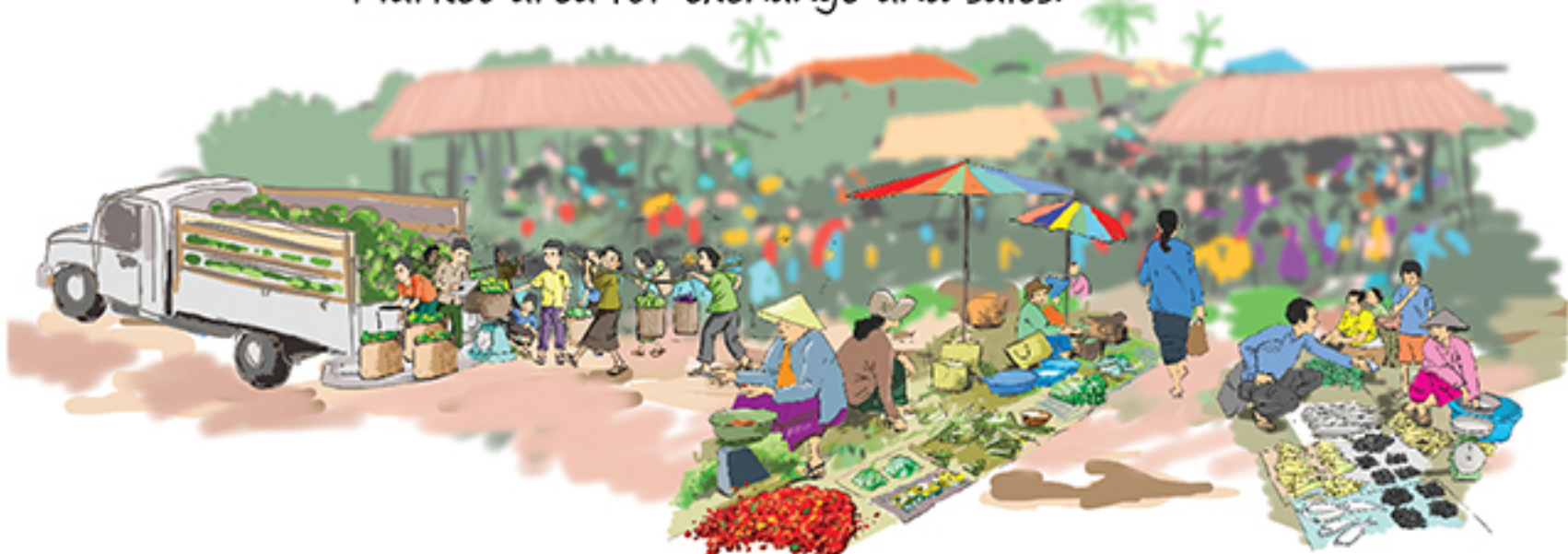
Market area for exchange and sales.