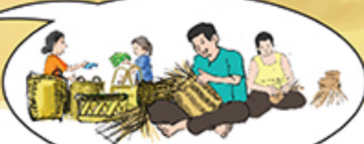
ຕະຫລາດສຳລັບເປັນຈຸດແລກປ່ຽນສິນຄ້າ ແລະ ການຊື້ຂາຍ